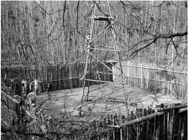
Le palais royal de Klow en 2003