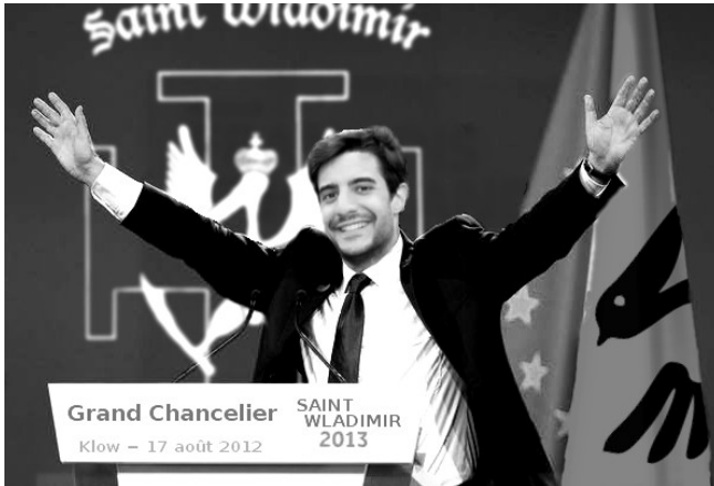
Le chancelier profite de la foule en délire après l'annonce de la Saint Wladimir 2013.

La chancellerie a orchestré l'annonce en invitant 5000 personnes au Palais Omnisport de Klow